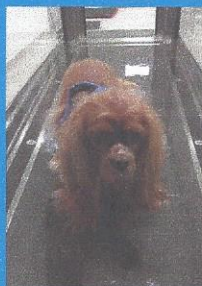
Ixie sur le tapis : les opérations des ligaments croisés demandent une longue rééducation

Ixie est une Cavalier King Charles de 4 ans, venue après une opération des ligaments croisés de la patte postérieure gauche. Sa maîtresse était septique sur l'hydrothérapie, pourtant recommandée par son vétérinaire. « J'ai été bluffée par le résultat, raconte-t-elle ! Nous avons fait une quinzaine de séances mais déjà après trois visites, le résultat était impressionnant. En plus, elle adorait ça » ! Aujourd'hui non seulement Ixie court mieux qu'avant mais en plus elle s'est musclée et affinée !