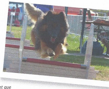
Gump en concours : les sports canins sollicitent les muscles et les articulations.

Plus d'infos sur : www.tbe-titouetbienetre.com Demandez conseil à votre vétérinaire.